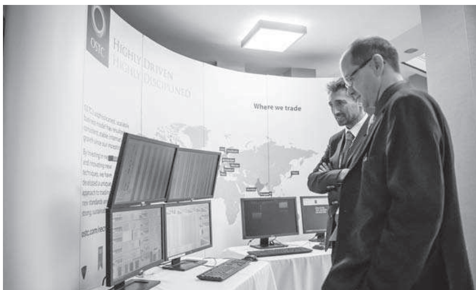
Stanowisko Partnera Głównego Konferencji firmy OSTC Poland